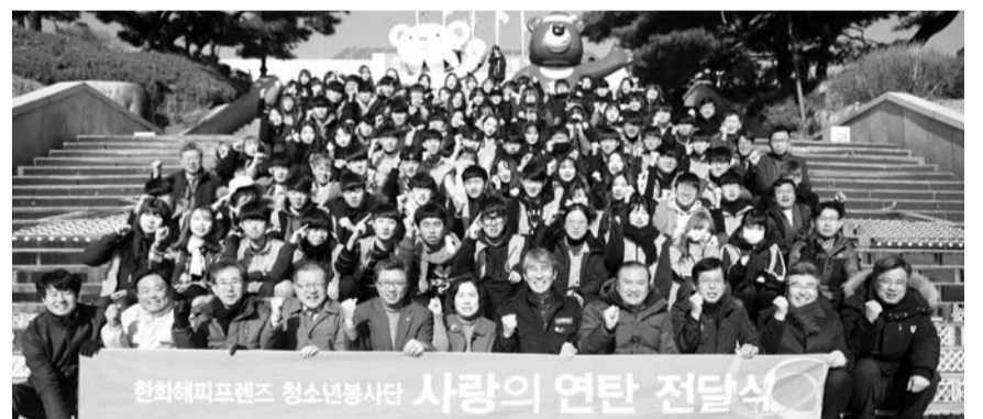
한화생명, 해피프렌즈 청소년 봉사단 겨울 봉사캠프 한화생명 한화해피프렌즈 청소년봉사단은 지난 10일부터 12일까지 2박 3일 동안 강원도 영월에서 1년 간의 봉사활동을 마무리하는 겨울 봉사캠프를 펼쳤다고 한화생명이 15일 밝혔다. 이번 겨울 봉사캠프는 전국 각 지역의 봉사단원들이 한 자리에 모여 한 해 동안의 활동을 정리하기 위한 자리로 마련됐다. 캠프에 참여한 330여 명의 봉사단원들은 강원도 7개 폐광지역 250여 가정에 연탄 6만장을 전달하는 등 연탄 배달 봉사로 한 해 활동을 뜻 깊게 마무리했다.