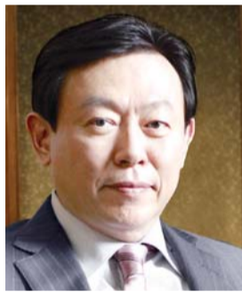
신동빈 롯데그룹 회장

신동빈 롯데그룹 회장은 31일 서울 마곡에 위치한 롯데 중앙연구소에서 개최된 '2018 상반기 롯데 사장단회의'인 '벨류 크리에이션 미팅'(VCM)'에서 임직원들에게 명확한 목표와 새로운 비전을 가질 것을 주문했다. 최근 호주 오픈 테니스 대회에서 4강 신화를 이뤄낸 정현 선수처럼 도전 정신