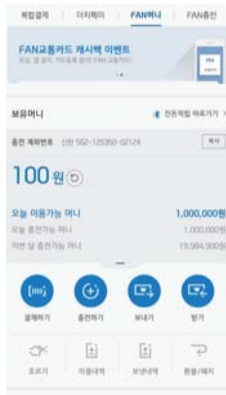
신한 FAN머니 메인화면

FAN머니는 온·오프라인 가맹점에서 신용카드처럼 자유롭게 결제할 수 있는 기능을 더한 신개념 지불결제수단이다. 고객은 FAN머니에 최대 50만원까지 계좌이체, 무통장입금, 포인트 등으로 충전한 후 충전금액 범위 내에서 개인간 송금, 온·오프라인 신용카드 가맹점 결제, 충전금액 선물 등이 가능하다.