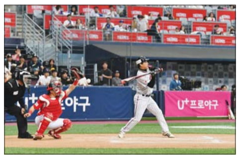
10일 고척돔에서 진행된 'U+프로야구와 함께하는 2018 사회인 야구대회'의 결승전에 앞서 열린 농아인 야구단 '청주 기드온 이글스'와 LG윙글러스 사내 야구단 '윙글러스 레드릭스'의 친선경기가 진행되고 있다.

우리는 최정화이 만들어내는 불안의 세계에서 우리의 진실을 목도하게 된다. 여러 각도로 놓인 거울을 통해 우리가 평소 보지 못하던 측면을 마주하듯이, 최정화가 펼쳐놓는 이야기들이 우리가 미처 보지 못한 우리의 모습을 드러내는 것. 마치 히스테리에 시달리고 있는 듯한 최정화 소설 속 인물들은 우리와 멀어 보이기도 하고 어쩔 땐 우리 자신 같기도 하다. 그의 소설은 사람들이 불안을 어떻게 받아들이는지에 대해 말하는 듯하다가, 어느새 불안해하는 우리가 어떻게 행동하는지, 그리고 어디로 향하는지로 나아간다. 244쪽, 1만2000원 /신정원 기자 sjw199@metroseoul.co.kr