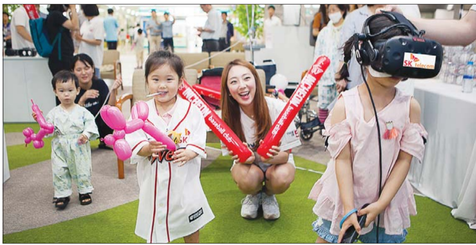
SK텔레콤이 16일 인천시 중구 인하대병원 로비에 마련한 '찾아가는 야구장'에서 어린이 환자들이 가상현실 기기를 통해 야구 게임을 즐기고 있다.

찾아가는 야구장은 거동이 불편해 야구장에 방문하기 어려운 어린이들을 위해 기획됐다. SK텔레콤은 인천 'SK 행복드림구장'의 1루 등 원석, 포수 뒷편, 외야석에 360도 카메라 총 3대를 설치했다. 카메라가 찍은 영상은 인하대 병원에 마련한 대형TV 4대와 가상현실기기(HMD) 3대를 통해 생중계됐다. 중계에는 SK텔레콤 360도 실시간 생중계 기술이 활용됐다.