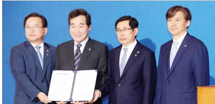
정부가 사법경찰과 검찰의 수평적 수사권 조정 합의문을 21일 발표했다. 이날 오전 10시 정부서울청사에서 김부겸 행정안전부 장관, 이낙연 국무총리, 박상기 법무부장관, 조국 청와대 민정수석이 서명한 합의문을 들고 있다.

사법경찰에 대한 검찰의 수사지휘권이 폐지되고, 경찰이 모든 사건에 대한 1차 수사권과 종결권을 갖게 된다. (관련기사 3면) 정부는 수직관계였던 검찰과 경찰을 상호협력관계로 바꾸고, 검찰의 직접 수사 범위를 제한하는 검·경 수사권 조정 합의문을 21일 발표했다. 이낙연 국무총리는 이날 오전 10시 정부서울청사에서 대국민담화로 입법을 통한 정치권의 협조를 요청했다. 이어 박상기 법무부장관과 김부겸 행정안전부장관이 검·경 수사권 조정 합의문에 서명했다. 정부는 수사와 공소제기, 공소유지의 원활한 수행을 위해 검·경을 수직이 아닌 상호협력관계로 설정했다. 이에 따라 경찰 수사에 대한 검사의 송치 전 수사지휘가 폐지된다. 경찰은 모든 사건에 대해 1차적 수사권과 수사종결권을 갖게 된다. 검찰은 기소권과 함께 ▲일부