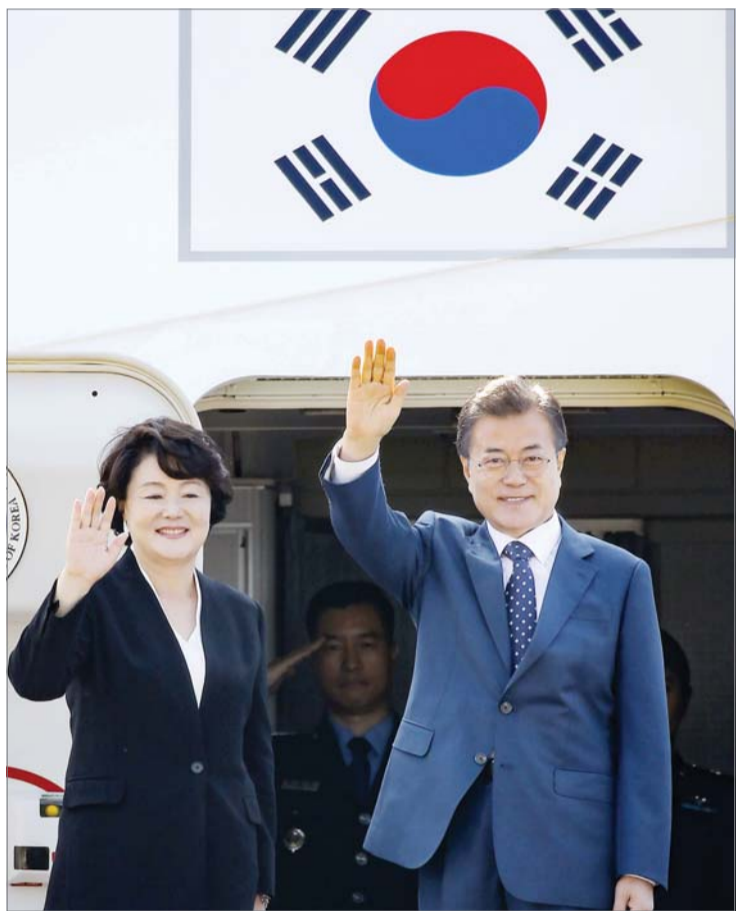
“러시아 잘 다녀오겠습니다” 문재인 대통령과 부인 김정숙 여사가 21일 오전 서울공항에서 러시아 국빈 방문을 위해 출국하며 손을 흔들어 인사하고 있다.