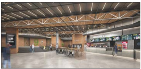
CGV강변 리뉴얼 오픈