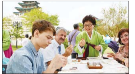
궁중음식축제 참가자를 모습.

서울 종로구는 오는 10월 개최되는 '궁중과 사대부가의 전통음식 축제'의 체험 프로그램과 참가자 공모를 진행한다고 2일 밝혔다.