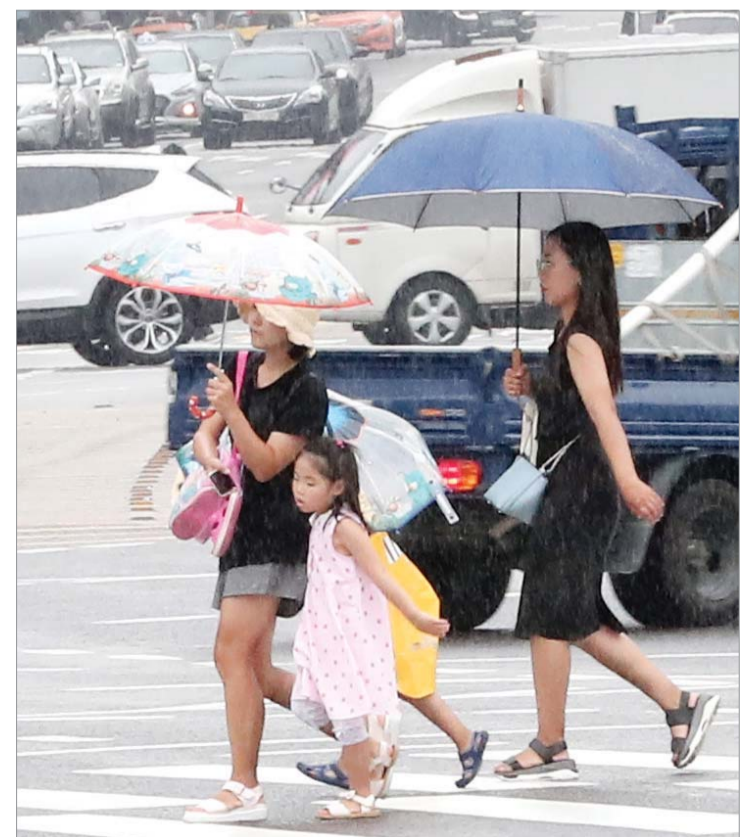
소나기 내리는 도심

전국 곳곳에 소나기가 내리고 있는 9일 오후 중구 서울광장 인근에서 시민이 내리는 비를 맞으며 발걸음을 재촉하고 있다. 기상청은 당분간 35도 안팎의 폭염이 이어지며, 밤에는 열대야가 계속될 것이라고 밝혔다.