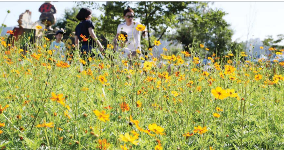
가을 반기는 코스모스

선선한 가을 날씨를 보인 2일 오전 서울 여의도 한강공원에 노랑코스모스가 활짝 피어 가을을 받고 있다.