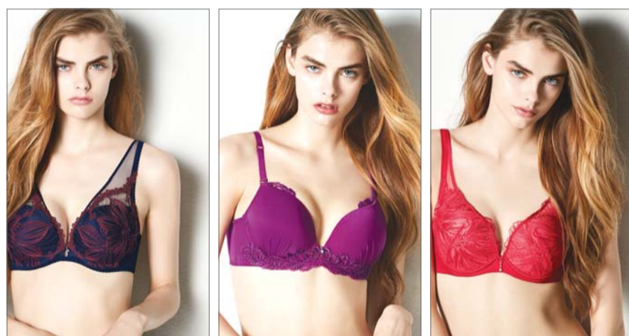
착용감 강조한 폴립 브라 모델 착용컷

비비안 디자인실 감지영 팀장은 18일 “지난 가을에는 차분한 버건디 컬러가 강세를 이뤘으나 올 가을에는 레드, 그린, 퍼플 등 채도 높은 다채로운 색상이 유행할 전망”이라며 “컬러는 과감하면서도 컵을 감싸는 자수 장식이 섬세하게 표현돼 매끄러운 실루엣을 연출해준다”고 말