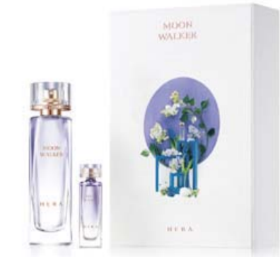
헤라 ‘문 워커 오드 뚜왈렛’

AHC는 ‘EYE LOVE YOU’ 추석 선물세트 4종을 베스트 셀러인 아이크림 포 페이스 시리즈의 최신판인 얼티밋 리얼 아이크림 포 페이스를 중심으로 특별 에디션 구성으로 선보였다. 아이크림 포 페이스는 뛰어난 안티에이징 효과가 특징으로 누적 판매 6700만개를 돌파한 얼굴 전체에 바르는 아이크림이다. 함께 구성된 골드, 진주 아이크림 에디션들은 리얼