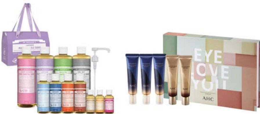
닥터 브로너스 ‘매직숍 스페셜 기프트 박스’

선선해진 가을 날씨와 완벽하게 어울리는 부드러운 향기로, 첫 향은 청량한 베르가못이 히야신스, 갈바넵과 조화를 이루고 이어지는 마들노트에서는 라일락