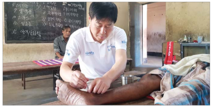
포스코건설은 지난 4일부터 3일간 방글라데시 마타바리에 있는 푸란 바자(Puran Bazar) 초등학교에서 대한한방해외 의료봉사단과 함께 한의약 의료 봉사활동을 실시했다. 사진은 의료봉사단이 진료를 하고 있다.

앞서 지난달 25일 현장 인근 11개 학교에 노트북, 빔 프로젝트, 스크린 등 IT 교육 기자재를 기증하고 설치하는 봉사활동을 시행했다.