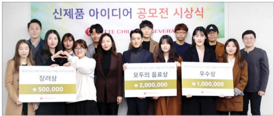
롯데칠성음료, 신제품 아이디어 공모전 1위에 차차르간주스 선정 롯데칠성음료는 '제1회 모두의 음료 신제품 아이디어 공모전'에서 비타민나무열매를 원료로 한 '차차르간주스'가 1등으로 선정됐다고 12일 밝혔다. 총 1007건의 아이디어 중 1등으로 선정된 차차르간주스는 '차차르간(비타민나무를 의미하는 몽골어)'의 열매를 주원료로 하는 비타민음료다.

인사 ◆ 소비자경제신문 △ 대표이사/발행인 고동석 △ 상무이사/광고국장 최세현