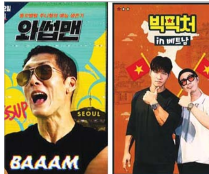
와쌌맨, 빅픽처 /스튜디오 롤루랄라, SM C&C·미스틱엔터테인먼트

여의도 일대 직장인들로부터 선풍적인 인기를 끌었다. 2년 넘게 운영한 결과 이용률도 꾸준히 증가해 시행 초기 대비 약 65% 이상 늘었다.