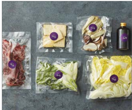
모바일 프리미엄 마트마켓컬리, 블랙라벨 홈다이너 밀키트&디저트 /마켓컬리

최근에는 클릭 한번이면 다음날 아침 일찍 힐링푸드를 받아볼 수 있는 서비스들이 속속 등장했다. 모바일 프리미엄 마트마켓컬리는 음식의 재료를 모두 준비하고 손질해 레시피 카드와 함께 밀키트(Meal Kit)를 제공하는 '블랙라벨 홈다이너'를 선보이고 있다. '스키야키', '연어참치장', '양장피'와 같이 재료 준비가 다소 번거로운 메뉴도 레시피 카드에 적힌 순