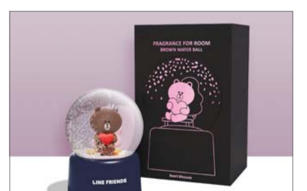
홈즈 에어후레쉬 라인프렌즈 워터볼방향제.

홈즈 에어후레쉬 라인프렌즈 워터볼 방향제는 최근 젊은 소비자를 중심으로 실내 인테리어 소품에 대한 관심이 높