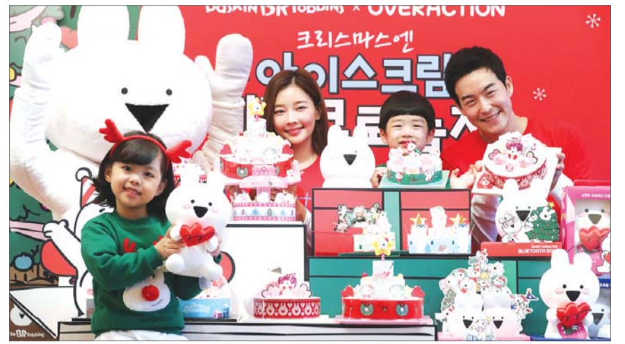
베이스킨라빈스 “크리스마스엔 오버액션토끼와 함께~” 베이스킨라빈스가 3일 오전 서울 소공동 웨스틴 조선호텔에서 크리스마스 시즌을 맞아 출시한 ‘시크릿 회전목마’, ‘시크릿 3단 트리’, ‘시크릿 팝업북’, ‘시크릿 오버액션토끼’를 비롯한 아이스크림 케이크 26종을 선보이고 있다.