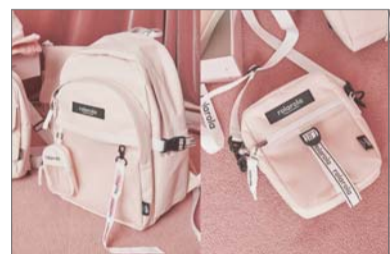
슈펜이 로라로라와 함께 출시한 협업 상품 백팩.

패션·뷰티업계가 연초부터 다양한 협업을 진행하며 새로운 시도에 나서고 있다. 타 브랜드와 맞손을 잡거나 뷰티 크리에이터, 인기 캐릭터 등과 함께 이색 제품을 출시해 기존 고객은 물론, 신규 고객의 마음까지 사로잡겠다는 의도다.