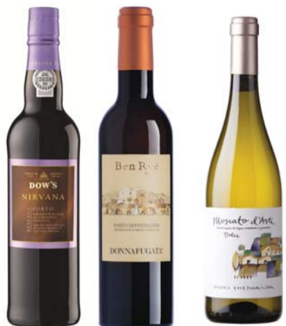
(왼쪽부터)다우 너바나 리저브 포트, 돈나푸가타 베리에, 아랄디카 모스카토 다스티 돌체

단 음식에는 달지 않은 음료를 곁들인다. 커피 역시 달달한 디저트의 맛과 향을 살려주기 위해선 아메리카노 등 '단 쓴' 조합이 더 낫다.