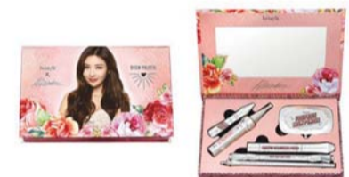
베네프트의 '베네프트 X 이사배 브로우 팔레트'.

에스의 '하트 발렌타인 브라'는 연핑크 바탕에 레드 하트 패턴이 돋보이는 제품이다. 섹시쿠키의 '비 마인 핑크 브라'는 톤을 다르게 매치한 핑크 컬러와 큰 사이즈의 리본 장식 콘셉트로 구성됐다. 오는 14일까지는 전국 매장과 온라인몰에서 '좋은사람들X 키셔 발렌타인 프로모션'을 실시, 할인 및 증정품 제공 등이 진행된다.