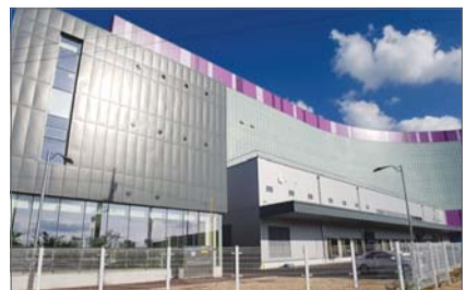
BGF 인천 중앙물류센터 전경.

BGF리테일은 이런 성과를 인정받아 업계에서 유일하게 지난 2013년 '우수녹