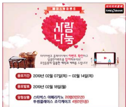
이스 조각케익 교환권이 증정된다.

타이어뱅크가 발렌타인데이를 앞두고 '사랑 나눔 이벤트'를 진행한다. 11일 타이어뱅크에 따르면 이번 이벤트는 2월 14일까지 타이어뱅크 페이스북을 통해 진행되며 발렌타인데이를 맞이해 가족과 연인 등 사랑하는 사람들과 즐거움을 나누기 위해 준비됐다. 응모는 타이어뱅크 유튜브에서 '달콤영상'을 시청한 뒤 페이스북 페이지에 응모하면 된다. 종류 후 스타벅스 커피 교환권, 투썸플레이스 조각케익 교환권이 증정된다.