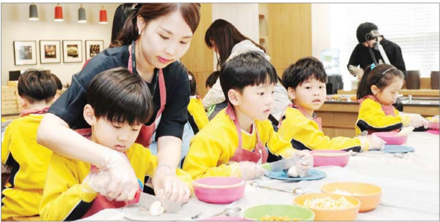
풀무원 뮤지엄김치간, '김치학교' 무료운영 풀무원이 운영하는 뮤지엄김치간은 김치를 쉽게 배우고 체험할 수 있는 '김치학교'를 무료로 운영하고 11일 밝혔다. 뮤지엄김치간은 올해 어린이 김치학교, 다문화 김치학교, 외국인 김치학교 등 3개 체험 교육 프로그램을 운영하여 총 7421명에게 무료 교육 기회를 제공할 계획이다. /풀무원