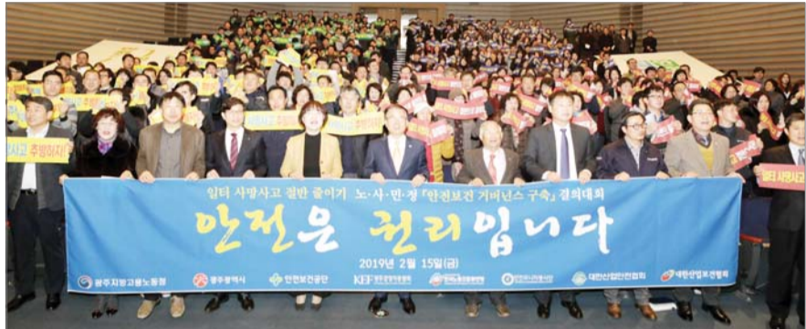
안전보건공단, 안전보건 거버넌스 구축 결의대회... 안전보건공단 광주지역본부는 지난 15일 광주광역시청에서 안전보건 거버넌스 구축 결의대회를 실시했다.