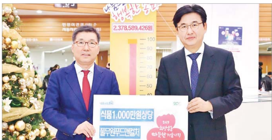
풀무원푸드앤컬처, 송파구청에 모금 후원물품 기탁... 풀무원푸드앤컬처가 서울시 송파구 소외이웃을 위한 '희망은 따뜻한 겨울나기' 나눔 활동에 나섰다.