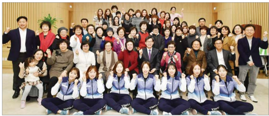
NH협은행, 정구팀 창단 60주년 기념행사... NH협은행은 지난 16일 경기도 고양시 덕양구에 위치한 농협대학교에서 정구팀 창단 60주년 기념행사를 개최했다고 17일 밝혔다.