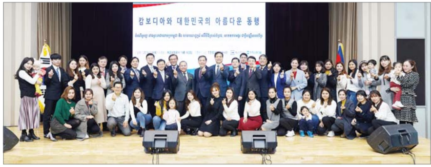
예보, 우리금융과 캄보디아 가족 초청 문화나눔행사... 예금보험공사와 우리금융그룹이 지난 16일 캄보디아 가족 초청 문화나눔행사를 개최했다고 17일 밝혔다.