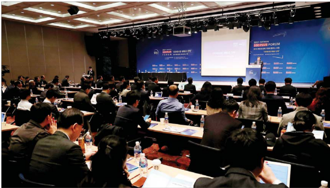
28일 오전 서울 영등포구 중소기업중앙회에서 메트로경제 주최로 열린 ‘2019 메트로경제 100세 플러스 포럼’에 참석한 원승연 금융감독원 부원장이 축사를 하고 있다.

이날 포럼에는 150여 명의 투자자와 금융업계 관계자가 참석해 100세 시대 장수리스크를 어떻게 극복할 것인지 함께 고민했다. 특히 수명은 늘어나는 데 반해 가계 부채는 급증했고, 증시와 부동산 모두 예측하기 힘든 상황인 만큼 이번 포럼에 대한 관심도 컸다.