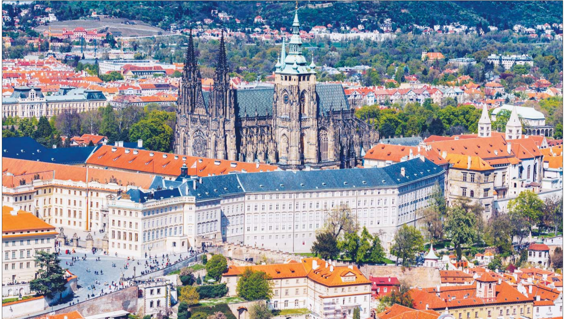
통치자들의 궁전 '프라하 성'. 황금소로를 따라 걷다보면 마치 카프카의 소설처럼 '성'이 보인다.