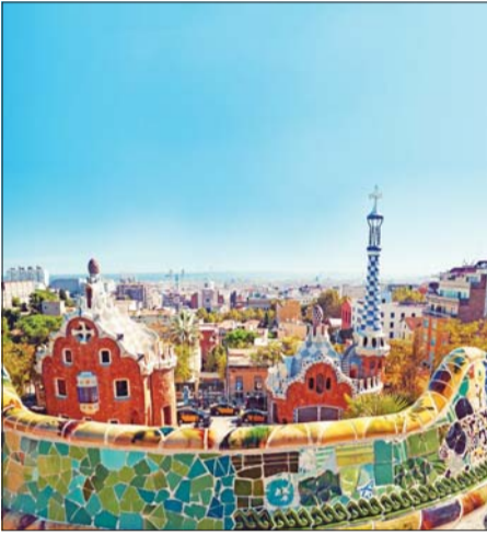
'너는 사랑이다, 스페인'