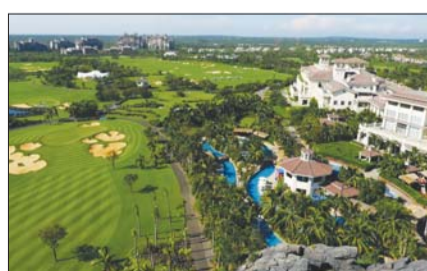
미션힐스 하이난 전경.

이번 참가자 146명은 부부, 친구, 동문회, 골프동호회 등 다양한 팀들로 구