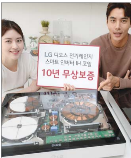
LG전자는 전기레인지 핵심부품 무상보증 기간도 10년으로 연장했다.