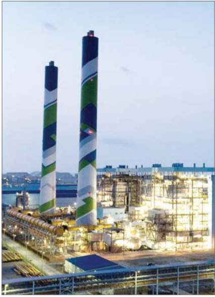
현대제철 당진제철소 전경.