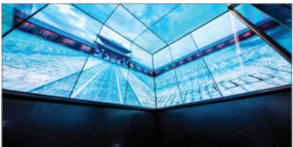
서울스카이 스카이스터 내부

롯데월드타워 전망대 서울스카이는 지난달 31일 싱가포르 인터콘티넨탈 호텔에서 열린 '2019 아시아-태평양 스티비 어워드(이하 스티비 어워드)' 시상식에서 금상과 은상을 수상했다고 4일 밝혔다.