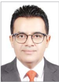
오스만 알 감디 에쓰오일 CEO

에쓰오일은 5일 세계 환경의 날을 맞아 서울 마포구 본사 대강당에서 '2019 멸종위기 천연기념물 지킴이 캠페인 발대식'을 열고 한국수달보호협회, 한국민물고기보존협회, 천연기념물곤충연구회, 한국조류보호협회, 한국두루미보호협회 등 환경 단체에 후원금 2억5000만원을 전달했다고 4일 밝혔다.