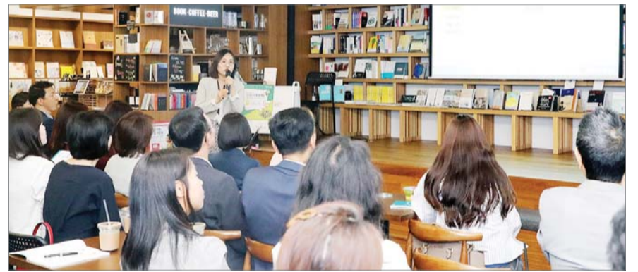
KEB하나은행은 지난 3일 컬처뱅크 광화문역지점에서 '은퇴설계콘서트'를 개최했다.

1부에서는 KEB하나은행 은퇴설계센터 전문가가 '위풍당당 월급사용 설명서'를 주제로 소비 패턴에 따른 필요 노후생활비와 은퇴자금 마련 법에 대해 세미나를 진행했다. 이어진 2부 순서에서는 '2019 부동산 트렌드'를 주제로 잦은 부동산 정책 변화에 따른 불확실성 확대에 대비한 부동산 재테크 전략과 공격연금 및 개인연금을 활용한 연금설계 활용법이 상세하게 소개됐다. 3부는 Q&A 순서로 각 분야별 은퇴