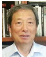
신 세 철 역 쉬운 경제

채권 투자에서 원리금 손실 위험을 미리 고려하지 않으면 낭패할 수 있다. 채권투자 위험은 크게 보아 채권발행주체의 지불불능위험 정도에 따라 ①원리금상환불능위험과 ②시장금리 상승에 따른 채권가격하락 위험이 있다. 해외채권에 투자할 때 ③환위험을 고려하여야 뜻밖의 손실을 피할 수 있다.