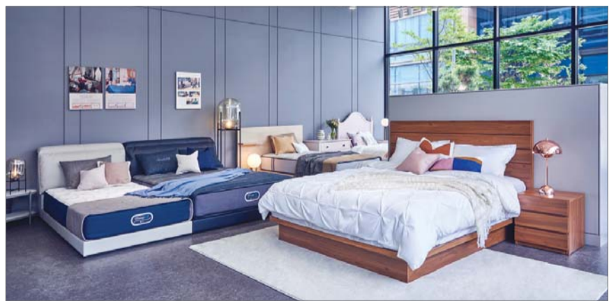
시몬스가 대전 유성구에 새로 선보인 유성점 내부 전경.

시몬스 침대는 대전 유성점 오픈을 기념해 해당 매장에서 일정 금액 이상 구매 시 시몬스가 제안하는 라이프스타일 컬렉션 케노사의 호텔 침구 세트 또는 포켓스프링 배개를 증정하는 이벤트를 진행한다. /김승호 기자