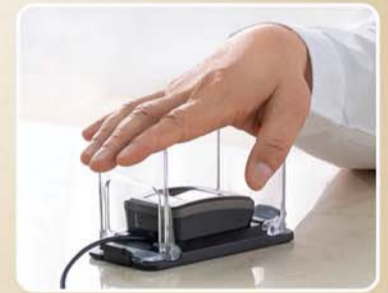
[손으로 출금 서비스] 국내 금융사 최초, 손바닥 정맥 인증 창구 출금 서비스