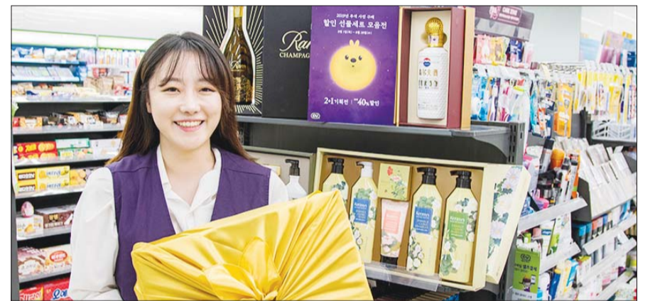
CU에서 선물세트를 들고 있는 직원.

편의점 GS25는 소셜네트워크서비스(SNS) 화제 상품부터 프리미엄 선물군까지 700여 종의 추석 선물세트를 준비했다. GS25는 SNS 트렌드를 반영해 ‘클럭(Klug)미니마사지기세트’와 ‘퓨어썬 샤워기+필터세트’, LED마스크, 안마의자 2종 등을 선보인다.