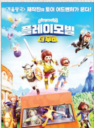
플레이모빌: 더 무비