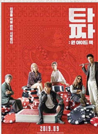
타짜: 원 아이드 잭