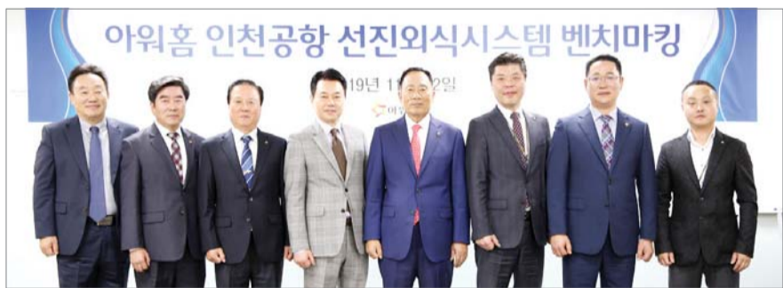
아워홈-외식업중앙회 대중소업체 동반성장 '맞손' 아워홈은 지난 12일 인천국제공항 제 2터미널에 위치한 컨세션 사업장에 한국외식업중앙회 회장단이 방문해 '외식업 운영 우수 사례 견학 프로그램'을 진행했다고 13일 밝혔다. 이번 '외식업 운영 우수 사례 견학 프로그램'은 지난 5월 아워홈 등 외식 대기업 22개사와 한국외식업중앙회가 맺은 자율적 '음식점업 상생협약' 실천의 일환으로 진행됐다.