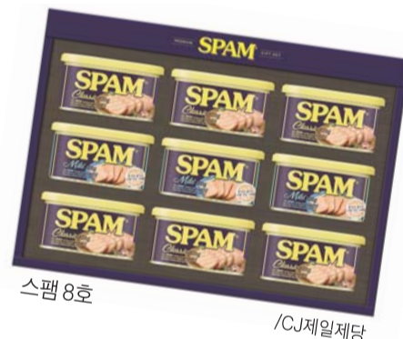
스팸 8호 /CJ제일제당

캔햄 카테고리에서 15년 연속 1위를 유지하고 있는 스팸으로 구성된 스팸