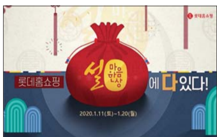
롯데홈쇼핑 설 마음 한상 특집전 이미지.

롯데홈쇼핑은 설을 앞두고 오는 11일부터 20일까지 인기 먹거리와 선물세트 등을 다양한 혜택으로 선보이는 '설 마음 한상' 특집전을 진행한다.