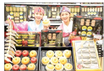
이마트에서 모델들이 설 선물세트를 선보이고 있다.

이마트가 설 명절을 약 2주가량 앞두고 1월 9일부터 성수점, 용산점, 구로점 등 기업체 및 공단 수요가 많은 점포 34곳에서 우선적으로 선물세트 전개 및 판매에 돌입한다.