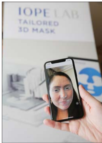
CES 2020 3D프린팅 맞춤형 마스크팩 얼굴 계속 장면.

해당 공간에는 아모레퍼시픽 외에도 3D 프린팅, AI(인공지능), 스마트홈, VR/AR(가상현실/증강현실), IoT(사물인터넷) 등 다양한 분야에서 혁신상을 수상한 올해의 첨단 기술과 장비들이