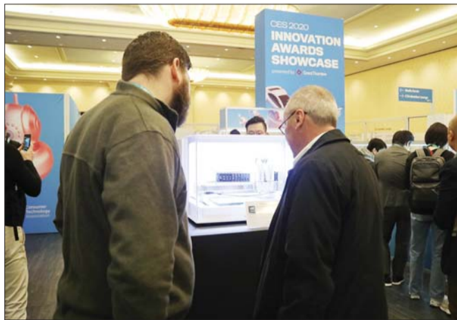
CES 2020 혁신상 수상 쇼케이스에 전시된 3D프린팅 맞춤형 마스크팩.