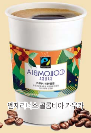
엔제리너스 콜롬비아 카우카