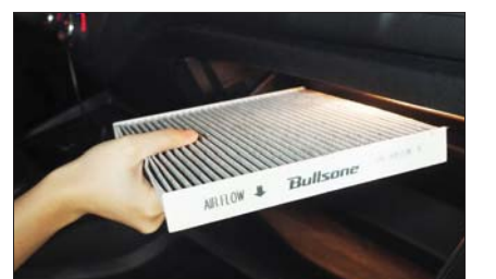
블스원 에어컨·히터필터.

블스원은 온라인 쇼핑몰 11번가에 가장 먼저 신제품을 공개한다. 가격은 '블스원 미세먼지 차단 에어컨·히터 필