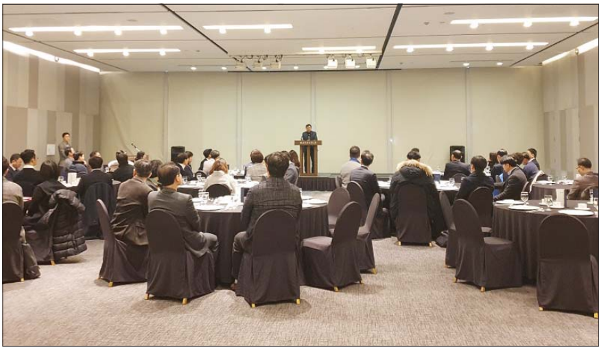
홈쇼핑이 지난달 30일 서울 강서구 메이필드 호텔에서 협력사 40여 곳을 초청, 간담회를 진행하고 있다.