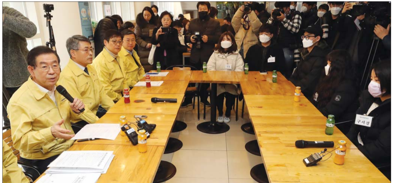
중국인 학생들과 간담회 하는 박원순 시장

박원순 서울시장(4일 동대문구 서울시립대학교 생활관에서 중국인 학생들과 신종코로나 바이러스 관련 간담회를 하고 있다.)