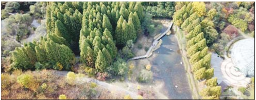
경기도 물향기수목원에 조성된 습지생태원 전경