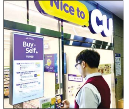
CU 바이셀프 100호점

CU가 사람과 기술이 함께 어우러진 하이브리드 편의점인 ‘CU 바이셀프(Buy-self)’ 100호점의 문을 열었다고 24일 밝혔다.