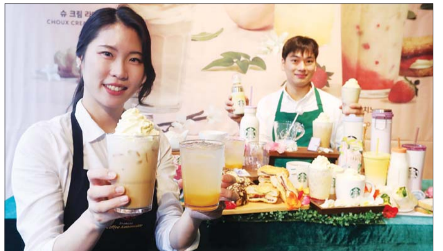
스타벅스, 봄 시그니처 음료 출시