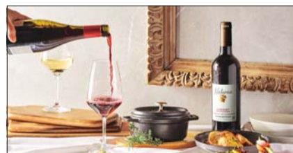
인터컨티넨탈 비건 와인(Vegan Wine)과 비건 메뉴 페어링