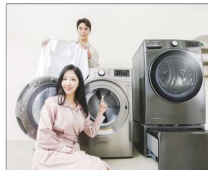
LG 트롬 건조기 스팀 썬큐.

트롬 건조 방식은 100% 저온제습이다. 4세대 듀얼 인버터 히트펌프 기술로 열풍을 만들어준다. 냉매를 압축하는 실린더 2개를 담은 대용량 컴프레서를 탑재해 성능뿐 아니라 에너지 효율