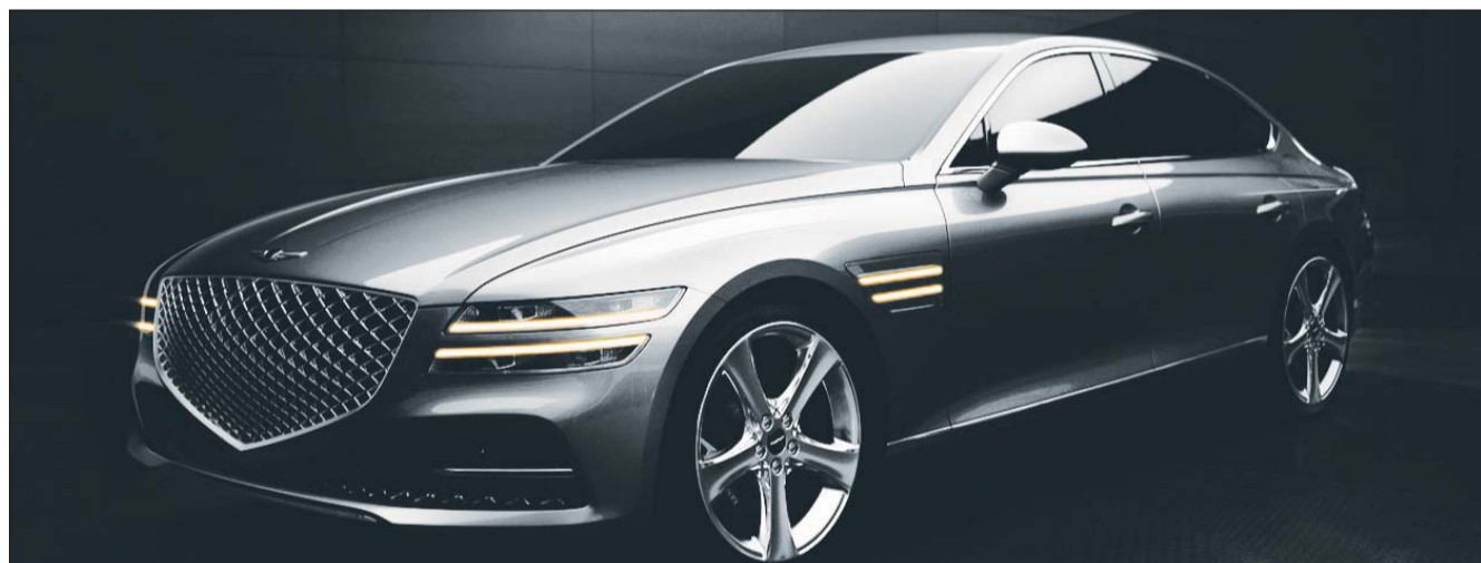
제네시스 3세대 G80 전측면.

사업장 내에도 여러 방비 태세를 추가했다. 식사시간을 분산하기 위해 구내 식당 운영시간을 연장하고, 좌석마다 가림막을 설치해 만약의 사태에 대비했다. 테이크아웃 메뉴도 새로 구성해 개인 공간에서 식사할 수 있도록 배려도 했다. /김재용 기자 juk@metroseoul.co.kr