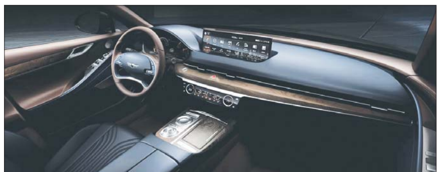
제네시스 3세대 G80 실내모습.

운전자의 손이 닿는 주 조작부(센터 콘솔)는 회전 조작 방식의 원형 전자식 변속기(SBW)와 터치 및 필기 방식으로 인포테인먼트 시스템을 조작할 수 있는 제네시스 통합 컨트롤러(필기인식 조작계)를 적용해 사용의 직관성을 높였다. /양성운 기자 ysw@