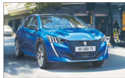
2020 유럽 올해의 차에 선정된 푸조 208.

분 143만원에 추가해 3008SUV 알튀르 590만원, GT라인 730만원, GT 836만원 등 할인 혜택을 준비했다. 푸조 308 GT도 493만원 할인해준다. /김재용 기자