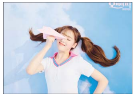
롯데홈쇼핑 미디어커머스 콘텐츠 '오마이픽'

밀레니얼세대부터 중장년까지 공략 일상 영상에 자연스러운 노출 등 사전 예고 영상 조회수 40만뷰 돌파