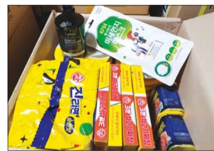
문경시가 지급하는 생필품패키지

생필품패키지는 보건소와 사회복지과 1:1 전담 공무원이 직접 자가격리자의 가정을 방문해 비대면 방식으로 전달하고 있다. 문경시는 코로나19 사태가 장기화되면서 현재 자가격리 중인 시