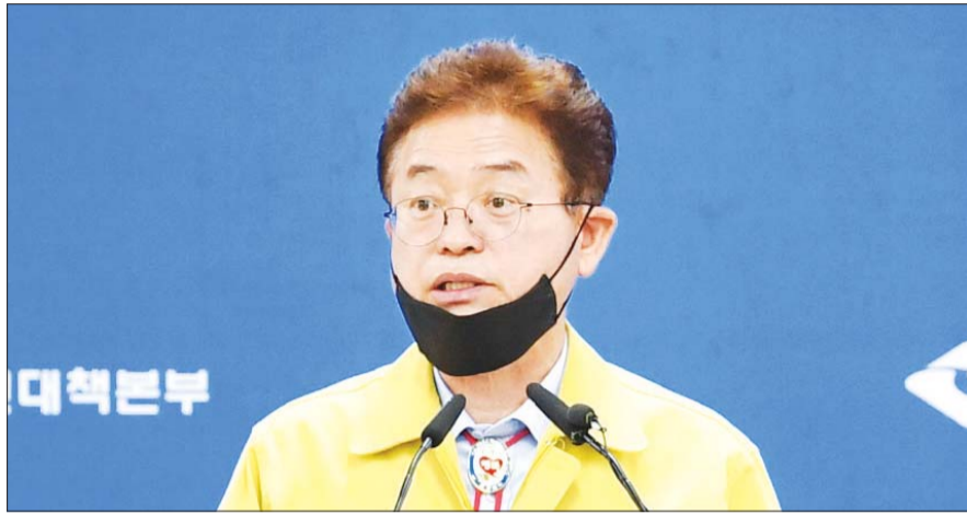
이철우 경북도지사가 지난 3일 경상북도 재난안전대책본부에서 열린 코로나19 정례 브리핑에서 발언하고 있다.