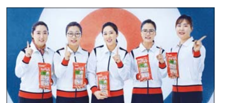
‘팀 킴’ 의성마늘햄 광고

팀 킴 모델 발탁을 통해 ‘의성마늘햄’ 브랜드를 더욱 널리 알릴 수 있었다는 게 회사 측 설명이다. / 김민지 기자 kmj@