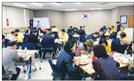
토란 시식회 현장

대표가 참여해 토란강정 등 20여 종의 토란 음식을 선보였다.