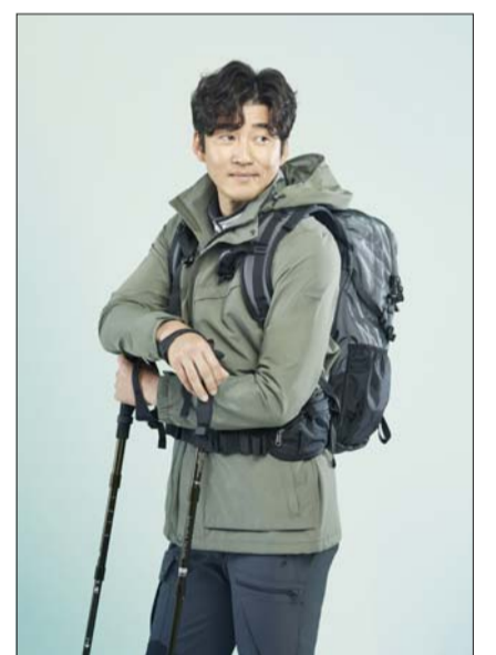
마운티아 2020 SS 화보컷

환경에 미치는 영향을 최소화한 '블루사인 인증(Bluesign)' 소재와 옥수수 전분에서 추출한 친환경 소재 '소로나 원단'을 사용한 제품을 새롭게 선보인다.