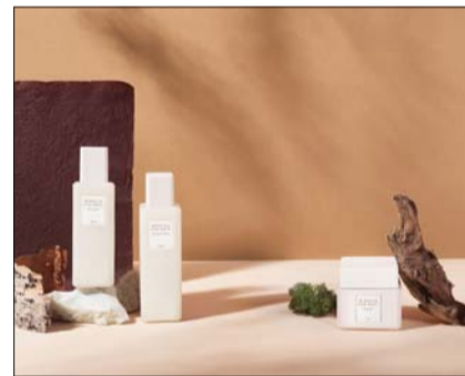
비온드 미라클 포레스트 라인

대표 제품인 '미라클 포레스트 컨센트레이트 크림'은 풍부한 영양감을 가진 동시에 끈적임이나 답답함 없는 소프트한 제형으로 피부에 편안하게 흡수된다. 실리콘 오일과 11가지 화학성