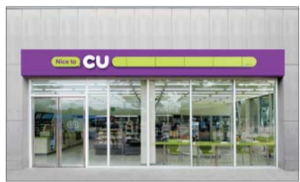
CU 점포 전경

이미 전국 모든 점포에 위생용품을 지급했고 향후 상황을 모니터링 하면서 해당 지역에 위생용품을 추가로 전달할 계획이다.