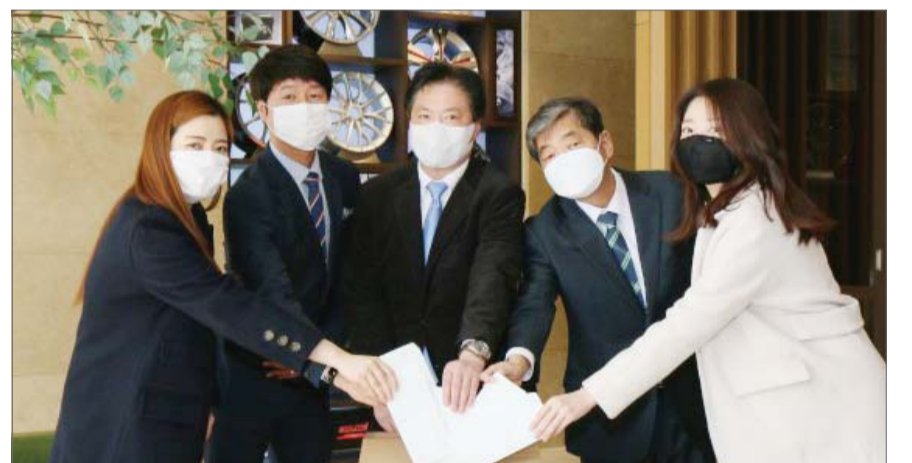
현대성우그룹 임직원들이 모금 캠페인에 참여하며 포즈를 취하고 있다.

성금은 계열사 기부금과 함께 전달되며, 의료와 취약계층 물품 지원, 방역과 예방 활동 등에 사용될 예정이다.