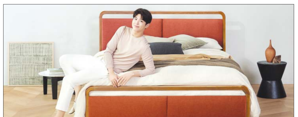
원목 프레임 침대 'BMA-1157'

특히 일반 폼과 달리 친환경 소재로 만든 바이오 폼을 적용해 부드러운 촉감을 주고, 높은 통기성을 유지해 쾌적한 수면 환경을 실현한다. 유럽산 최고급 위생원단인 '모스키토 프리 원단'은 집 먼지 진드기, 세균, 박테리아 등을 방지해 위생적이다.