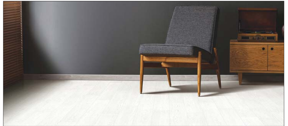
명가 프리미엄 트루 오크

또한 합판 대비 강화된 열전도 기질과 잠열성(열을 자체적으로 보유하려는 성질)을 가진 나프 보드를 사용해 바닥의 온기를 오랫동안 따뜻하게 유지할 수 있다. 나투스진 원목은 품격있는 디자인을 연출하면서 마루 손상에 우려도 낮췄다.