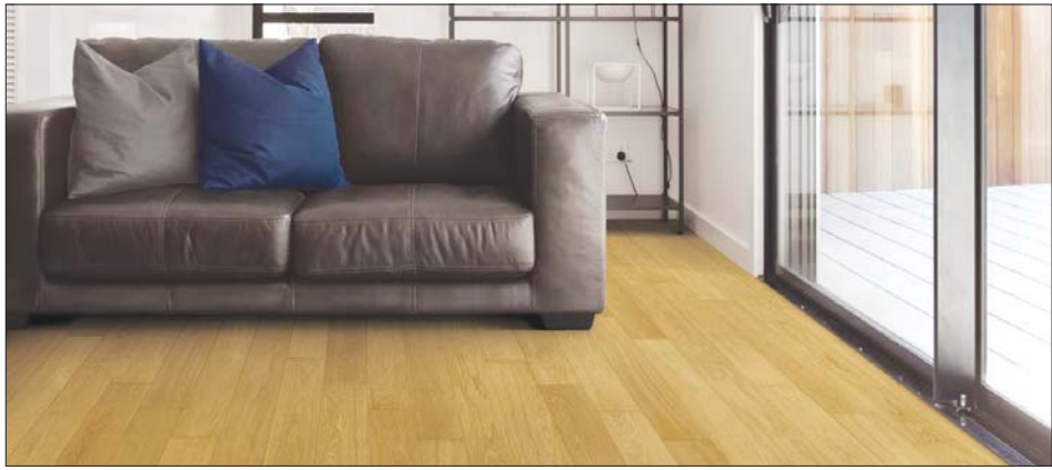
나투스진 원목 에이징 오크 패턴