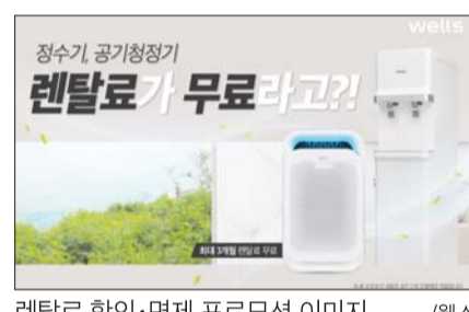
렌탈료 할인·면제 프로모션 이미지

웰스는 이달 28일까지 렌탈료 할인 및 면제 프로모션을 진행한다고 5일 밝혔다. '웰스 스탠드 정수기'(PK2)와 '16평형 웰스 공기청정기'(AL315) 렌탈 고객을 대상으로 진행되는 이번 프로모션은 한시적으로 등록비와 최대 3개월 렌탈료 면제, 특별할인 렌탈료를 적용해 약 정 기간 내 약 46만원 할인 혜택을 제공한다. ▲정수기 사용 중 또는 약정 만료 후 웰스 스탠드 정수기 렌탈을 원하는 신규 고객 ▲공기청정기 추가 렌탈을 원하는 기존 웰스 고객 ▲다른 제품과 공기청정기를 동시에 렌탈하는 신규 고객이라면 누구나 프로모션 혜택을 이용할 수 있다.