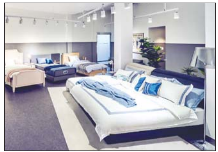
시몬스 맨션 강릉점

랑하는 매장에는 시몬스 침대의 대표 매트리스 컬렉션 '뷰티레스트'를 비롯해 라이프스타일 컬렉션 '케노샤'의 퍼니처와 베딩 등의 제품을 한자리에서 볼 수 있다.