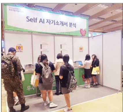
지난해 5월 28일 열린 '2019 제1차 KB굿잡 우수기업 취업박람회'

당초 6월 1일부터 이틀간의 일정으로 현장 취업박람회를 진행하려 했지만 정