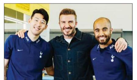
데이비드 베컴(가운데)이 손흥민 선수(왼쪽)와 기념촬영을 하고 있다.

영상은 베컴이 토트넘의 훈련장과 경기장을 찾아 감독, 1군팀 선수를 비롯한