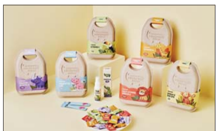
어린이 영양제 '미니맥스 정글' 7종.

미니맥스 정글은 종합영양, 성장발육을 위한 '미니맥스 정글 멀티비타민 미네랄', 뼈, 치아, 신경, 근육의 성장 발달을 위한 '미니맥스 정글 칼슘비타민D', 정상적인 면역기능, 배변관리, 장 건강을 위한 '미니맥스 정글 프로바이오틱스아연', 미세먼지와 바이러스,