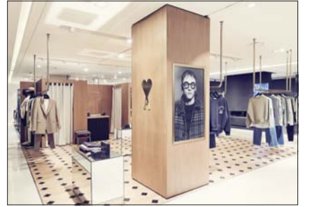
아미, 현대본점 매장 오픈

전체적인 우드 톤을 바탕으로 바다와 가구에 오크(oak, 참나무) 소재와 기하학적 패턴을 적용해 아미만의 친근하고 편안한 분위기를 자아낸다. 또 매장 중앙의 아미를 대표하는 하트 로고에 골드 컬러를 입혀 독특한 느낌도 더했다.