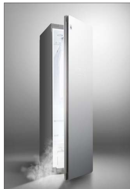
LG 트롬 스타일러.

단 삼성전자는 이미 손상된 마스크는 기능을 복원할 수 없다며, 식약처 권고사항과 마스크 제조사 사용상 주의사항을 준수하라고 당부했다. /김재용 기자 juk@