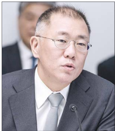
정희선 현대자동차그룹 수석부회장

현대·기아차-LG화학, 챌린지 공모 22일부터 7개분야 나눠 신청접수 최종선발 기업, 11월 美 워크숍 참석 상호협업·구체적 논의 등 진행키로