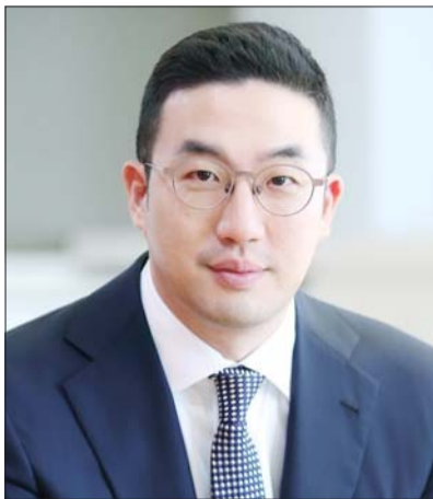
구광모 LG그룹 회장

정희선 현대자동차그룹 수석부회장과 구광모 LG그룹 회장이 전기차와 배터리 분야의 유망 스타트업 발굴을 위해 머리를 맞댄다. 글로벌 완성차 시장이 친환경차 중심으로 빠르게 전환되고 있는 가운데 미래 혁신을 이끌 전기차 배터리 기술 발굴과 전기차 시스템 개발 역량을 강화하기 위함이다.