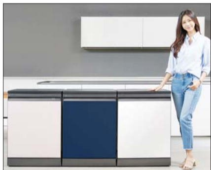
삼성전자는 비스포크 식기세척기를 출시했다.

한국형 기능도 여럿 담았다. ▲국내 최초의 4단 세척 날개로 ‘입체 물살’을 구현해 사각지대 없이 강력 세척 ▲높어 붙은 밥풀이나 양념도 깔끔하게 씻어내는 ‘스팀 블림’ 등 한국형 맞춤 옵션 ▲한식에서 자주 사용되는 오목한 그릇 수납에 용이한 ‘3단 한국형 선반 시스템’ 등을 적용하는 등 한국인 식생활에 최적화했다.