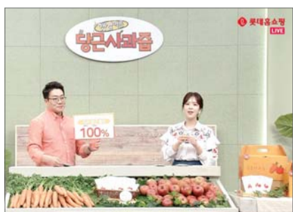
롯데홈쇼핑은 코로나19 피해가 큰 대구·경북, 부산·경남 지역 중소상공인을 우선적으로 선정해 TV와 티커머스를 통해 판로를 지원할 예정이다. /신원선 기자 tree6834@

이번 방송은 정부가 코로나19 위기 극복과 소비 진작을 위해 추진하는 '대한민국 동행세일' 참여의 일환으로 마