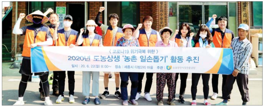
소진공 임직원들 '농촌돕기 봉사활동' 진행 소상공인시장진흥공단은 코로나19 장기화로 일손 부족 등의 어려움을 겪고 있는 농촌을 돕기 위해 자매결연 마을인 세종시 전의면 다방2리를 지난 22일 방문해 임직원들이 봉사활동을 했다고 23일 밝혔다. 소진공 임직원 20명은 이날 오전 8시부터 오후 4시까지 수박 비닐 씌우기 작업 및 부족한 일손을 도왔다.