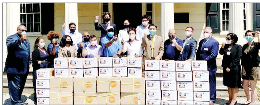
쌍방울, 뉴욕 한인회에 마스크 기부 쌍방울은 미국 뉴욕 한인이민사박물관을 통해 뉴욕 한인회에 트라이 면마스크 1만장을 전달하는 행사를 진행했다고 23일 밝혔다. 이번 뉴욕한인회 기부는 코로나19로 어려운 상황에 처해있는 재미동포들과 민족의 정을 나누고, 초기 미국 이민자들이 한문 두문 모아 독립운동 자금에 이바지한 역사를 우리 후손들이 반드시 기억하기를 바라는 마음에서 진행됐다.