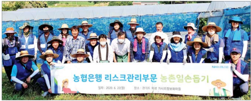
NH농협은행 리스크관리부, 자매결연 마을서 일손돕기 NH농협은행은 지난 22일 리스크관리부 임직원 20여명이 경기도 화성시 남양읍 가시리마을을 찾아 농촌일손돕기를 실시했다. 이날 일손돕기에는 해당 지역의 남양농협 임직원들도 함께해 바쁜 농가에 손을 보탬다.