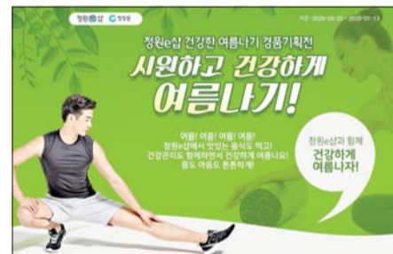
정원e샵 건강한 여름나기 경품기획전 /대상

신개념 폭립이다. 바삭하면서 촉촉한 폭립과 감칠맛 나는 소스가 조화를 이룬다. 폭립에 소스를 넣어 끓인 후 가장 맛있는 온도로 바로 즐길 수 있다. 일부 매장에서만 만나볼 수 있던 '시즐링 감바스'도 확대 출시했다. '시즐링 감바스'는 오동통한 새우와 쫄깃한 홍합에 고소한 오일 소스를 넣어 다양한 토핑과 함께 끓이는 요리다. /조효정 기자