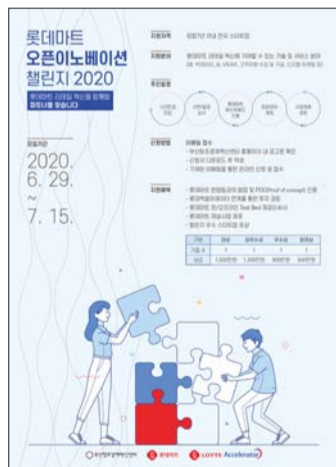
리테일테크 챌린지 포스터

오탈-비는 칫솔모 교체만으로 계속 사용이 가능한 '클릭'을 내놓았다. 일반 칫솔 대신 클릭을 사용하면 3개월 기준 플라스틱 폐기물 배출량을 최대 60%까지 줄일 수 있다.