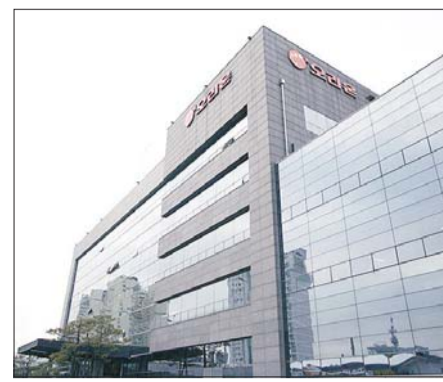
오리온 본사 전경.