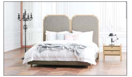
시몬스 침대 프레임 신제품 모나.

시몬스는 예비·신혼 부부를 위해 전국 시몬스 공식 매장에서 제품을 최대 20% 싸게 파는 이벤트를 진행한다고 2일 밝혔다.