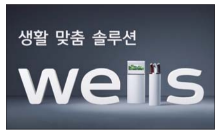
웰스의 TV 광고 화면.

웰스(Wells)는 '생활 맞춤 솔루션'을 소개하는 브랜드 TV광고를 새로 선보인다고 2일 밝혔다. 총 2편으로 구성된 이번 광고는 웰스 생활 맞춤 솔루션을 타이틀로 1일부터 공중파와 케이블 방송을 통해 순차적으로 소개될 예정이다.