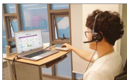
CU 온라인 창업설명회 개최 /BGF리테일

CU 창업설명회는 이전까지 본사에서 1대 다수의 대면 방식으로 진행됐지만 코로나19 확산 이후 생활방역 지침에 따라 잠정 중단된 상태였다. 전화상담 등으로 대체했지만 지속적인 창업 문의가 들어오면서 이달부터 온라인을 통한 창업설명회를 개최하게 된 것이다. CU에 접수된 창업 문의는 2분기