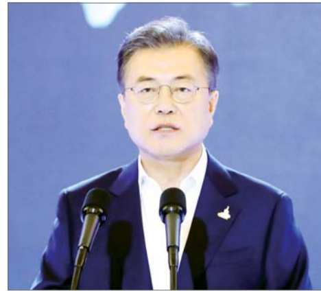
문재인 대통령이 14일 청와대 영빈관에서 열린 한국판 뉴딜 국민보고대회에서 발언하고 있다.

메트로미디어 주최 ‘2020 100세 플러스 포럼’ 오늘 오후 2시~5시, 명동 은행회관 2층 국제회의실