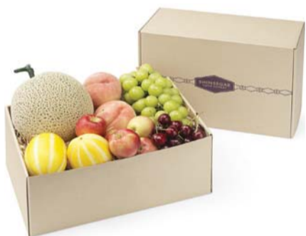
신세계 과일 정기 구독 선물 /신세계백화점

처음으로 선보인 과일 구독은 과일 뿐만 아니라 ▲과일을 고르는 요령 ▲과일 별 보관 방법 ▲맛있게 먹는 팁 ▲바이어가 직접 작성한 과일 설명서까지 동봉해 만족도를 높였다. 지난 8월에는 서비스 시작 석 달 만에 구독자 수가 150% 늘어나기도 했다.