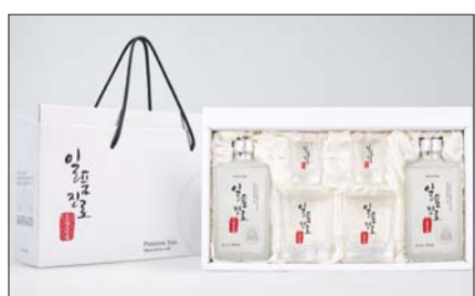
추석 명절 맞아 출시된 '일품진로1924' 선물세트.

선물세트는 일품진로 1924 (375ml) 2병과 전용잔(스트레이트 잔 2개, 언더