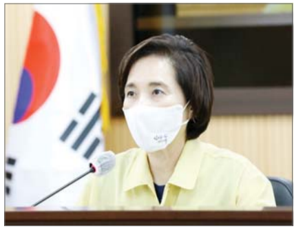
유은혜 부총리 겸 교육부 장관

유은혜 부총리 겸 교육부 장관은 14일 오전 10시30분 서울 영등포구 교육 시설재난공제회에서 한국학원연합회(회장 이우원, 이하 학원연합회)와 간담회를 갖는다. 유 부총리는 사회적 거리두기 조치 기간 학원에서 겪는 어려움을 듣고 감염병 확산을 차단하기 위한 협력 방안을 함께 논의할 예정이다. /한용수 기자 hys@