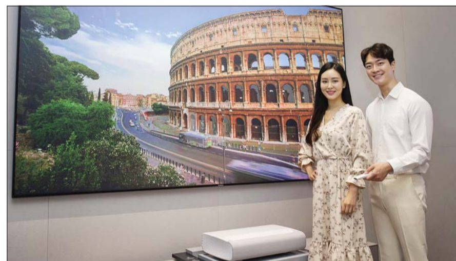
삼성전자 가정용 프로젝터 더 프리미어.

아울러 40W 내장 우퍼와 어쿠스틱 빔 서라운드 사운드로 영화 시청 환경을 극대화했다.