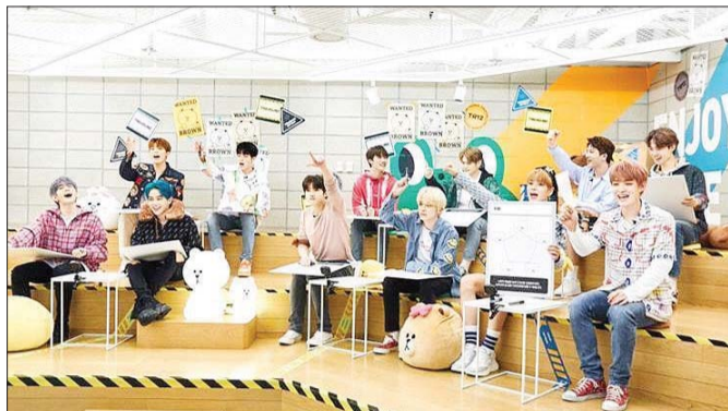
트레저가 자신들의 분신이자 동료로 활약할 신규 캐릭터 IP 제작을 위해 아이디어를 모으고 있는 모습.

우선, SK텔레콤과 카카오는 사조영 캐릭터를 활용해 오는 7일부터 SK텔레