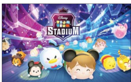
서바이벌 퍼즐게임 '츠무츠무 스타디움' 이미지.

라인(LINE) 메신저 친구나 게임 내 유저와 함께 최대 50명이 즐길 수 있는 실시간 대전을 제공한다. 또 소지한 캐