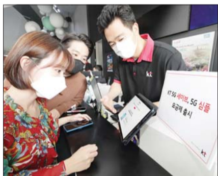
고객이 KT광화문빌딩에 위치한 대리점에서 5G 요금제에 대한 설명을 듣고 있다.

매월 110GB의 데이터를 쓸 수 있고, 기본 데이터를 사용한 후에는 5Mbps