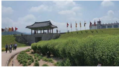
백제의 미소 서산, 태안 2일 299,000원

8월 28일에 첫 출발하는 2박 3일 문화유산답사 여행은 정신문화의 수도이고 세계문화유산으로 선정된 안동과, 예천, 영주의 아름다운 자연과 역사, 전통을 돌아보는 여행으로 안동하회마을, 병산서원, 도산서원과 예천의 삼강주막, 화룡포, 영주의 무성마을과 전통가옥 등을 돌아보며 숙박은 안동 고급호텔에서, 식사 역시 지역 최고의 특별식과 만찬으로 채워진다.