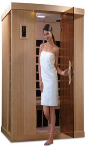
110x100 185W 1-2인용

사우나를 통해 노폐물을 내보내고, 세포의 재생을 도와 다이어트와 피부미용에도 효과가 있다. 무엇보다도 심뇌혈중 후 집에 들어왔을 때 바로 실내 사우나를 하고, 입고 있던 옷을 잠시 실내 사우나에 걸어두는 것 만으로도 바이러스를 차단할 수 있을 것이다. 리치하우징 실내 사우나는 현재 북유럽으로 수출되어 인기를 끌고 있는 상품이다. 또한 실내 건조 사우나로 보통 가정용 거실이나 방 또는 베란다에 설치가 가능하고, 초절전형으로 매일 1시간 사용해도 한달에 전기요금 7,000원 나온다. 또한 캐나다산 적삼목을 수입해서 국내에서 가공하여, 사우나의 본고장인 북유럽 핀란드에 수출하고 있으며, 시중에 유통되는 중국산 하고는 성능이나 효용면에서 큰 차이가 난다. 코로나로 바뀐 사우나문화 이전 가정에서 즐기는 문화로 정착을 할 것이다.