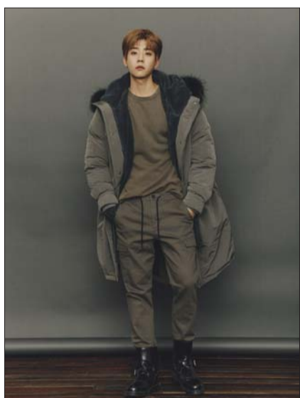
버커루가 한국인의 체형을 고려한 ‘12가지 데님 핏’을 공개했다. /한세엠케이

버커루가 선보이는 하의 상품들은 기존에 해외 사이즈로 제작돼 기장이 지나치게 길거나 밑위, 힙 등의 상세 사이즈가 한국인 체형에 적합하지 않았던 타 브랜드 하의류에 대한 국내 소비자들의 니즈를 반영했다. 수선이 필요하지 않은 내 몸에 꼭 맞는 핏을 목표로 브랜드만의 전문성을 높이는데 중점을 둔 것이다. 특히 버커루의 데님 라인업은 해외 기준의 사이즈보다 다리 기장을 약 1인치 줄이고 무릎선은 1인치 위로 올려 디자인하는 등 한국인의 신체 사이즈에 최적화된 핏을 세밀하게 연구했다. 총 12가지 핏으로 폭넓게 전개되는 버커루의 데님 상품으로 개인의 취향과 체형에 맞는 스타일을 연출할 수 있다. 버커루는 하의 중에서도 완벽한 핏을 구현하기 가장 까다로운 ‘데님’ 제