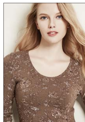
여성 겨울 내의

비비안 관계자는 “환절기에 체온이 1도 떨어지면 면역력이 그만큼 떨어지기 때문에 내의로 체온을 유지해야 한다”며 “특히 코로나19와 독감 유행으로 인해 건강에 각별히 신경 써야 하는 만큼 외부 활동서도 입을 수 있도록 신축성, 착용감 등을 고려해 내의를 구매하