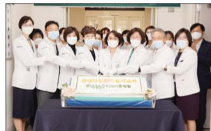
이대서울병원이 신생아중환자실 개소를 기념하여 촬영을 진행했다.

이번에 문을 연 신생아중환자실은 8병상 규모로 소아청소년과(소아신경, 소아감염, 소아심장 분과)와 산부인과를 비롯해 소아흉부외과, 소아영상의학과, 소아외과, 소아신경외과 등 소아 관련 전문 교수진의 유기적인 협진을 통해 신생아 및 미숙아 집중치료를 담